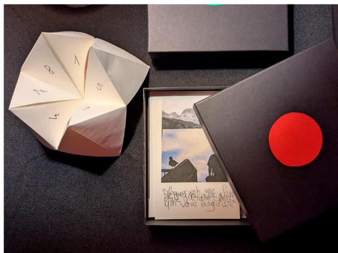
Restitution d'un travail autour de la santé mentale : installation au Grand Angle (Voiron, 38) dans le cadre du Festival Livres à Vous 2025